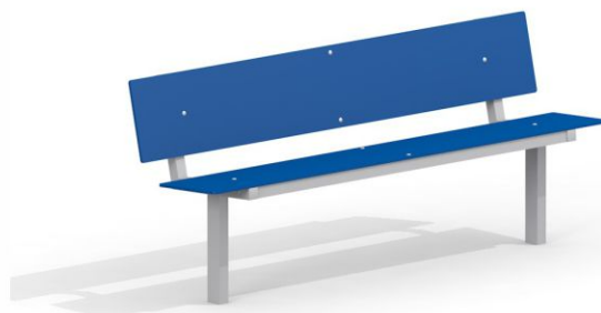
14453 x6 Ławka HPL