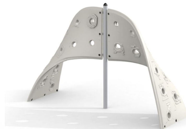
11305 Aztec łuk