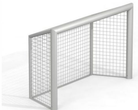
Bramka istniejąca zdjęcie poglądowe