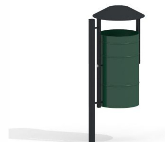
14409 x2 Kosz miejski